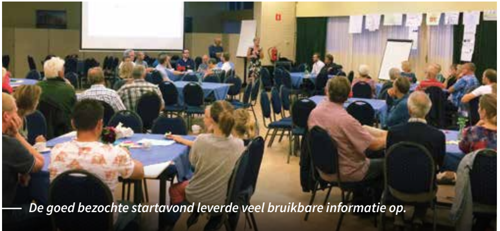
— De goed bezochte startavond leverde veel bruikbare informatie op.