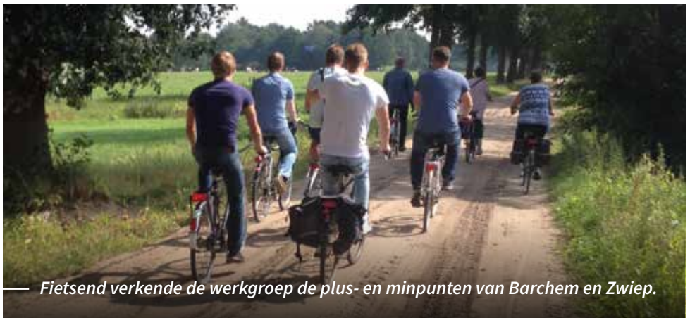
Fietsend verkende de werkgroep de plus- en minpunten van Barchem en Zwiiep.

Barchem en Zwiiep hebben zo'n 1.750 inwoners met een bevolkingsdichtheid van bijna 70 inwoners per vierkante kilometer. Er zijn iets meer vrouwen (885) dan mannen (870). De meeste inwoners zijn tussen de 45 en 65 jaar. De helft van alle inwoners is getrouwd. 5% van de inwoners is gescheiden en 6% is verweduwd (bron: CBS, 1-1-2017).