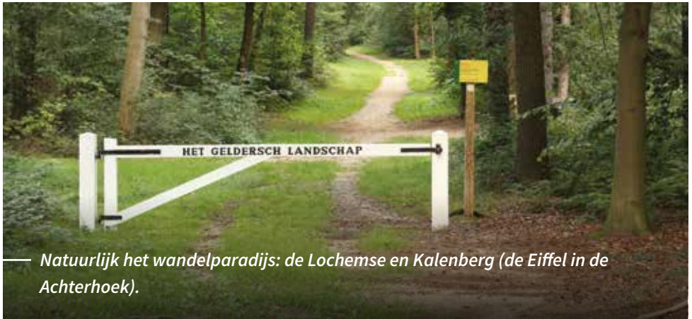
— Natuurlijk het wandelparadijs: de Lochemse en Kalenberg (de Eiffel in de Achterhoek).