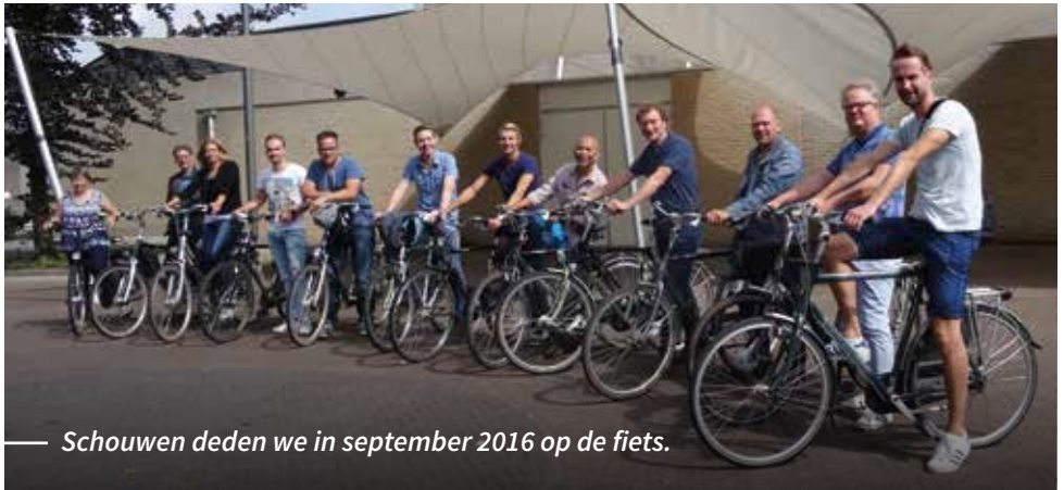
— Schouwen deden we in september 2016 op de fiets.

De leden van de werkgroep dorpsplan Barchem en Zwiep 2016-2026 hebben met veel enthousiasme gewerkt aan dit dorpsplan. Dit had echter niet gekund zonder de vele input van de inwoners van Zwiep en Barchem. Zij hebben hierdoor ook indirect hun betrokkenheid laten zien bij “hun” dorpen. Het is opvallend dat echte grote pijnpunten niet aanwezig lijken te zijn en inwoners graag het huidige leefklimaat met alle voorzieningen willen behouden of zelfs uitbreiden.