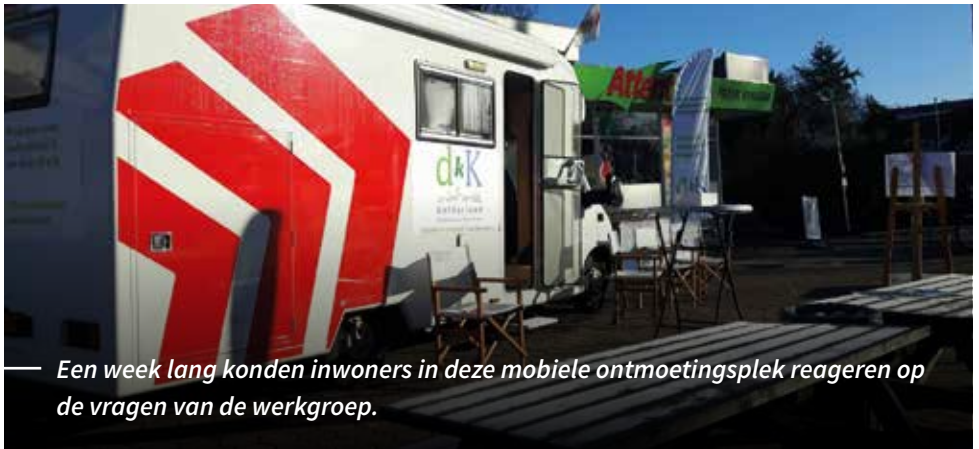
Een week lang konden inwoners in deze mobiele ontmoetingsplek reageren op de vragen van de werkgroep.

In het voorjaar van 2017 verzamelde de werkgroep per thema alle uitkomsten. Een van de belangrijkste uitkomsten is dat de inwoners van Barchem en Zwiep trots zijn op hun dorp. Opvallend veel mensen zeggen dat we moeten koesteren wat er is en duidelijk moeten beseffen dat we in een gezonde en fijne omgeving wonen, met basisvoorzieningen in het dorp of redelijk in de buurt. De gedetailleerde uitkomsten kunt u vinden op de website van Vereniging Contact Barchem.